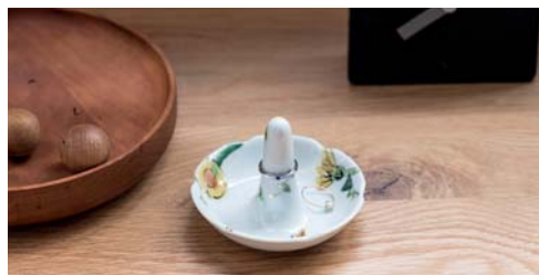
〈九谷焼〉(株)九谷陶泉