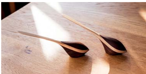
〈木工〉Frey design 甲斐 晋