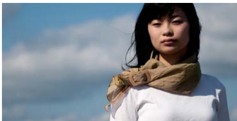
〈能登上布〉(株)山崎麻織物工房