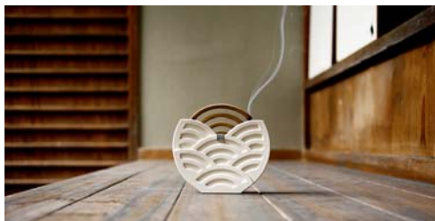
〈九谷焼〉(有)ミランティジャパン 九谷焼窯元 結