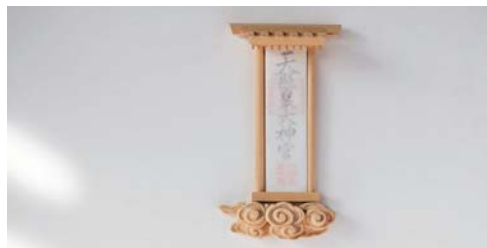
〈木工〉(株)池田大佛堂