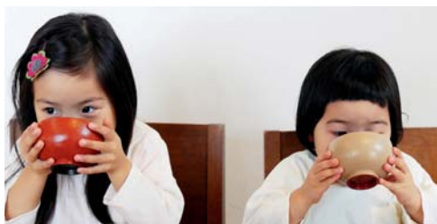
〈山中漆器〉(有)白鷺木工