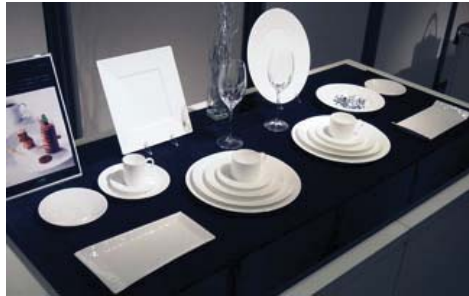
工業デザイン部門 『WASHI』 ニッコー (株)