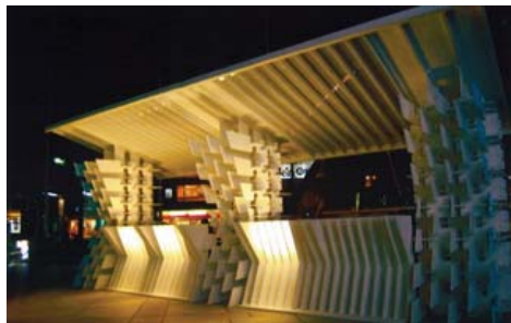
空間デザイン部門【インテリア】 『つきみ café/bar』 金沢工業大学川崎研究室