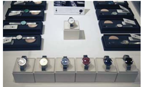
工業デザイン部門 『awase 合 合金ベルト漆シリーズ』 (有) シーブレーン