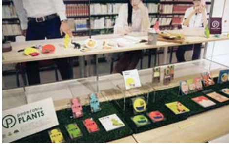
コミュニケーションデザイン部門 『paperable PLANTS』 (株) 山越 / root design office 原嶋 亮輔 原嶋 夏美