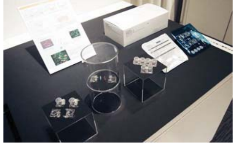
工業デザイン部門 『細胞培養容器 (NICO-1)』 伸晃化学 (株) / 学校法人金沢医科大学 伸晃化学 (株)