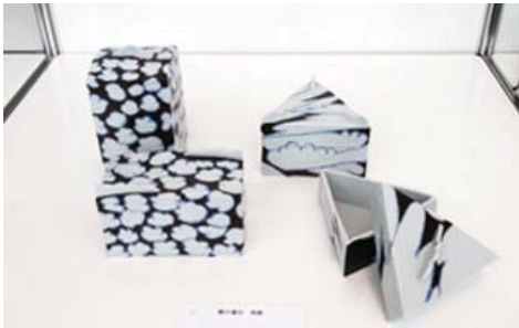
工芸デザイン部門 『雲の場合 角箱』 中村 功