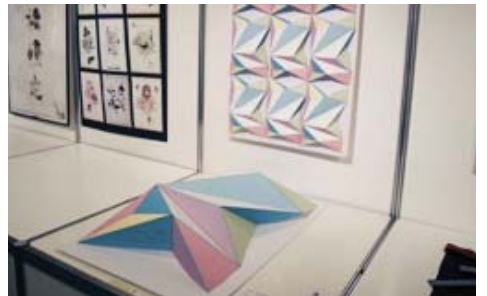
コミュニケーションデザイン部門 『ミネラルウォッチング』 (一社) こまつ観光物産ネットワーク / 横山真紀デザイン室 横山 真紀