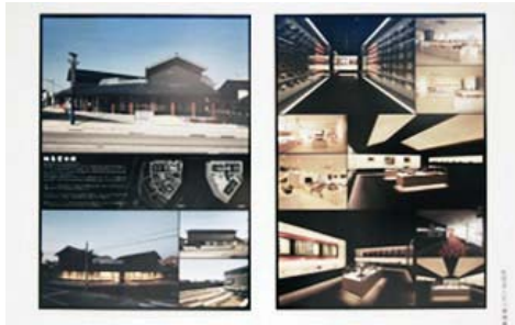
空間デザイン部門【建築】 『輪島塗会館』 (株) 浦建築研究所 / (株) 宮地組