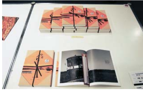
コミュニケーションデザイン部門 『KanazawaADC 年鑑 2014』 (株) 斉藤慶デザイン研究所 / 斉藤 慶